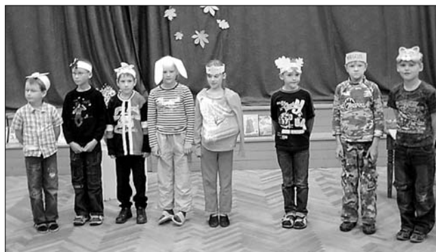
Vārkavas vidusskolas Dzejas diena 1.- 6.klases skolēniem.

Īsi pirms brīvdienām skolā arvien biežāk ieradās ve-