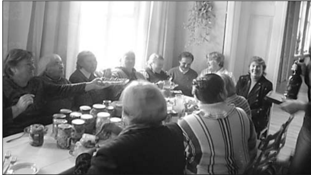
Pasākuma «Rudens veltes» apmeklētāji Vārkavas pagasta Tautas namā.

15. oktobrī Vārkavas Tautas nama telpās bija skatāma un baudāma izstāde - degustācija «Rudens veltes». Var tikai pabrīnīties par plašo rudens velšu sortimentu, ko bija sagādājušas Vārkavas pagasta saimnieces!