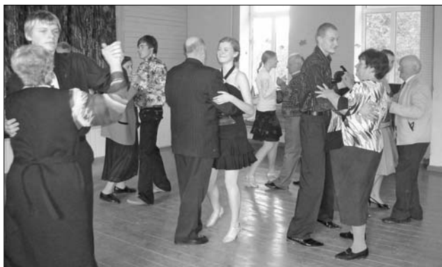
Vārkavas vidusskolas deļu kopas «Vita» dalībnieki izdancia pensionārus.

Pēc jaukā vakara pensionāri solījās arī nākamreiz apmeklēt šādus pasākumus. Tā ir lieliska iespēja izrauties no pelēcīgās ikdienas, tikties ar seniem draugiem,