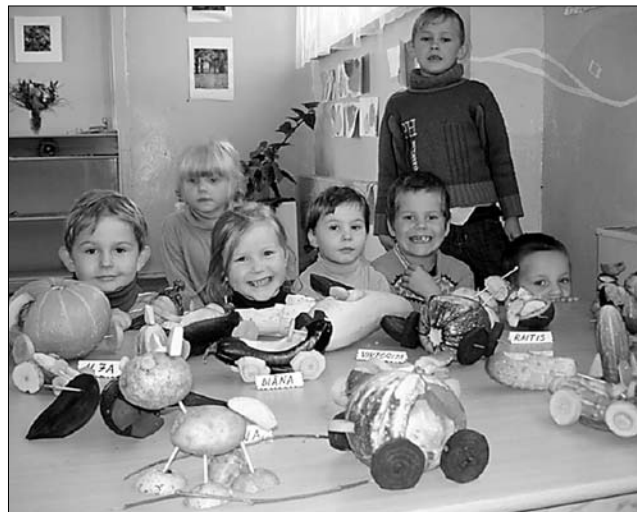
Ari paši mazākie Vārkavas pamatskolas skolēni varēs izmantot projekta «Skola lielam un mazam» piedāvātās iespējas.

Vēl tiks iekārtota tautas mūzikas instrumentu apmācības darbnīca, kurā varēs apgūt sitamo, pūšamo un stīgu instrumentu pielietošanas prasmes. Mērķis ir attīstīt prasmi darboties ar mūzikas instrumentiem un skaņu rikiem tradicionālajā latviešu folklorā, kā arī pilnveidot skolēnu un pagasta jauniešu muzikālās dotības un ritma izjūtu. Paredzamās aktivitātes – ierīkot skolā folkloras instrumentu apguves kabinetu, apgūt sitamo, pūšamo un stīgu instrumentu pielietošanas prasmes folkloras kopas kopskaņējuma veidošanā, apgūt pavadījumu folkloras kopai «Zubītes», sniegt koncertus vietējos un