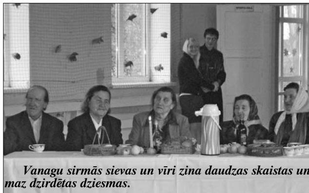
Vanagu sirmās sievas un vīri zina daudzas skaistas un maz dzirdētas dziesmas.

Bija rudenīga pēcpusdienu, 23. oktobris, kad Vanagu puses ļaudis, šoreiz pensionāri, pulcējās uz vakarēšanu. Vanadziešus uzrunāja novada domes priekšsēdētāja A. Vilcāne un novada sociālā darbiniece Z. Cirša. Kā jau visās novada vietās, arī Vanagos, pasākums notika ar novada sociālā dienesta atbalstu un tiešu līdzdalību.