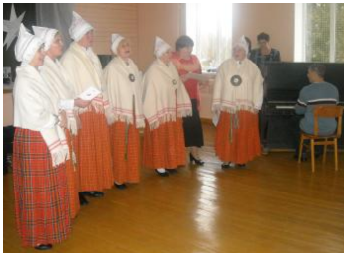
Folkloras kopa „Vecvārkava” pensionāru vakarā Vanagos.