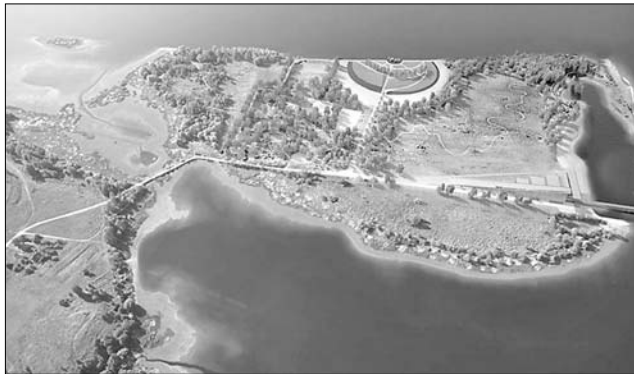
«Likteņdārzs» projekta vizualizācija (projekta autors – projektēšanas birojs «Arhis»).

Dārzs top kā kultūrvēstures un tūrisma objekts 22 hektāru platībā un tiek īstenots pēc pasaulē zināmā Japānas ainavu arhitekta Shunmyo Masuno ieceres (projekta vizualizācija – attēlā). Dārza veidotāju mērķis ir radīt unikālu vietu, kur cilvēki nāktu ar gaišām domām, atceroties pagātni, bet vienlaikus ar cerību raugoties nākotnē.