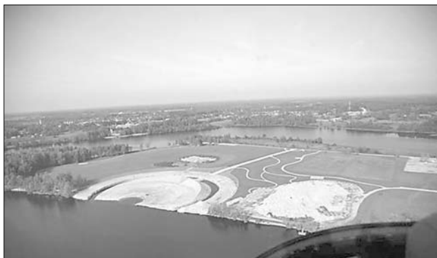
Skats uz «Likteņdārzu» no helikoptera 2010. gada rudenī.

Eiropas Sociālā fonda projekta «Darba praktizēšanas pasākumu nodrošināšana pašvaldībās darba iemaņu iegūšanai