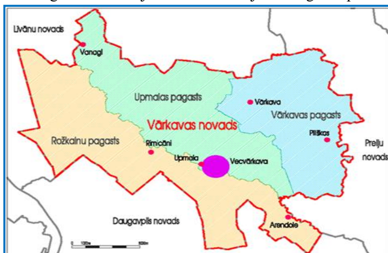
Attēlā – Vārkavas novada kaimiņu novadi un lielākās apdzīvotās vietas.

2002. gada 6. martā, apvienojot bijušā Preiļu rajona Rožkalnu un Upmalas pagastus, ir izveidots Vārkavas novads. Pēc administratīvi teritoriālās reformas pēdējā posma 2009. gada 1. jūlijā Vārkavas novads paplašinājās - tam pievienojās Vārkavas pagasts. Vārkavas novads atrodas Latvijas dienvidaustrumos. Tas robežojas ar Līvānu, Preiļu un Daugavpils novadiem. Vārkavas novadu veido Upmalas, Rožkalnu un Vārkavas pagasti. Administratīvais centrs – Vecvārkava (Upmala). Novada lielākās apdzīvotās vietas ir Vārkava, Vanagi, Rimicāni, Arendole, Piliškas. Vārkavas novadu 37 km garumā caurvij viena no lielākajām Daugavas pietekām – Dubna.